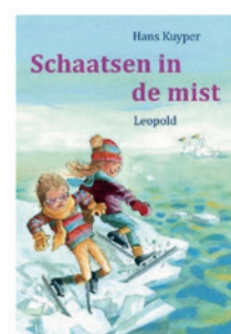
Schaatsen in de mist