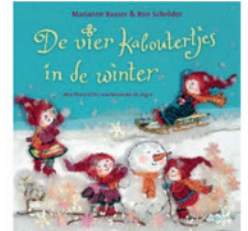
De vier kabouterkes in de winter