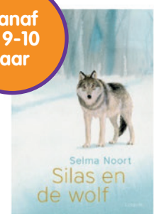
Silas en de wolf