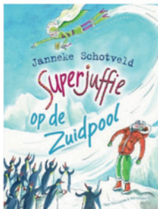
Superjuffie op de Zuidpool (deel 7)