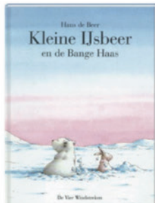
Kleine Ijsbeer en de bange haas (E3/M4)