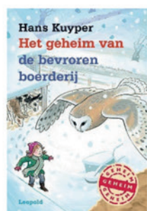
Het geheim van de bevroren boerderij