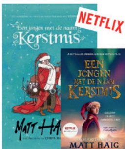
Een jongen met de naam Kerstmis