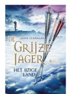
De Grietze Jager: Het ijzige land (deel 3)

Zowel boek als film zijn geschikt voor kinderen vanaf ± 9 jaar.