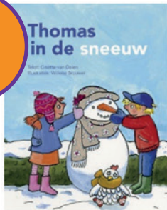
Thomas in de sneeuw (AVI S/M3)