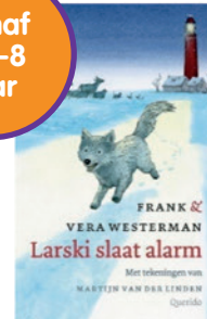
Larki slaat alarm