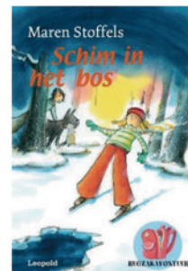
Schim in het bos