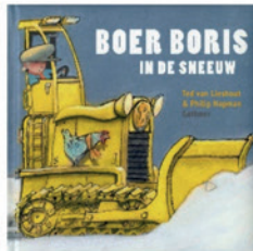
Boer Boris in de sneeuw