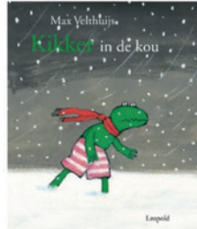
Kikker in de kou