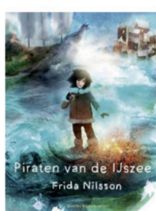
Piraten van de IJsee