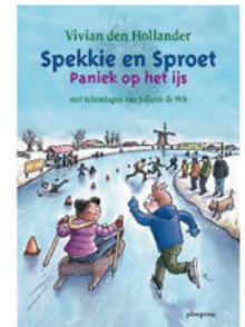
Paniek op het ijs