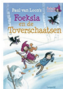
Foeksia en de Toverschaatsen (AVI M4)