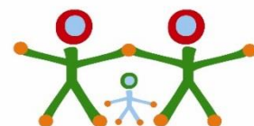
Oudervereniging BS Los Hoes

Gistermiddag kregen we bezoek van twee pieten. De kinderen hadden een heerlijke pietenmiddag. Wat hing er een fijne sfeer in de school. De foto's zijn al geplaatst op onze website.