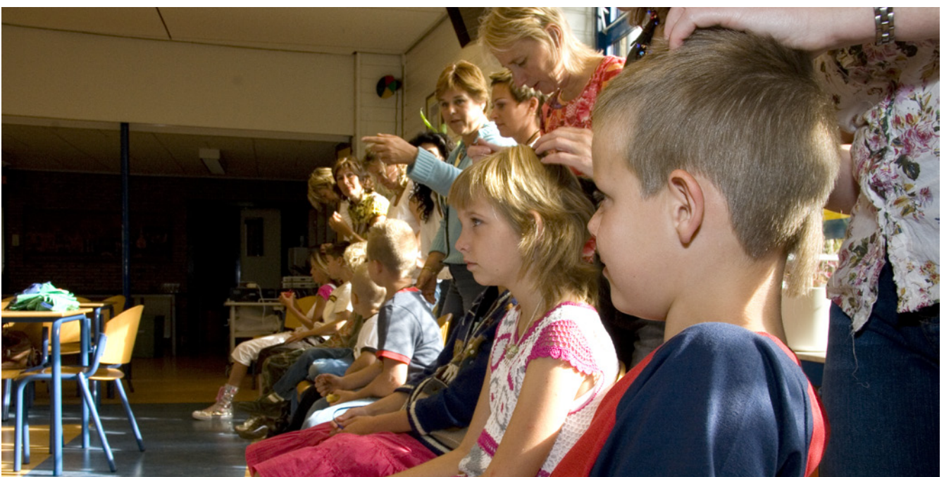
Een ouderwerkgroep kan op school de kinderen regelmatig controleren.

Daarnaast kunnen ouders én kinderen gestimuleerd worden om regelmatig te controleren op hoofdluis, en hoofdluis te melden aan de school. Als een kind hoofdluis heeft, is het verstandig om alle kinderen uit die groep een informatiebrief over hoofdluis mee naar huis te geven.