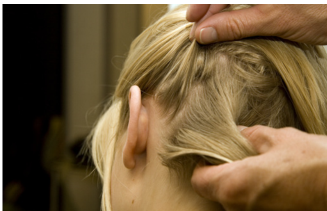
Als u op hoofdluis controleert, kijk dan goed tussen de haren.