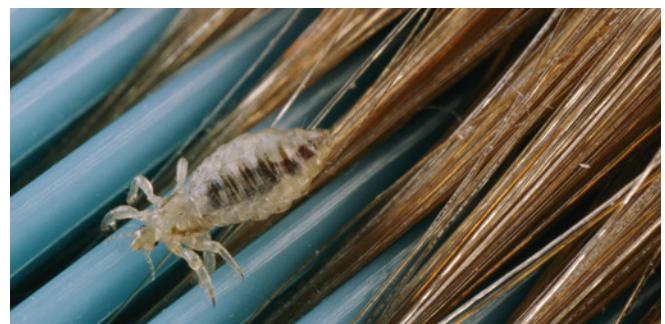
Een hoofdluis op een kam.

Hoofdluis is beslist geen drama en u hoeft uzelf niets te verwijten als uw kind hoofdluis heeft. Het is onschadelijk, maar het kan veel jeuk geven. En door krabben kunnen er infecties ontstaan. Het krijgen van hoofdluis heeft niets te maken met lichamelijke hygiëne.