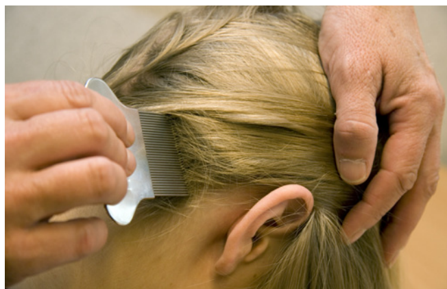
Kam het haar met een fijntandige kam boven een wit papier of de wasbak.