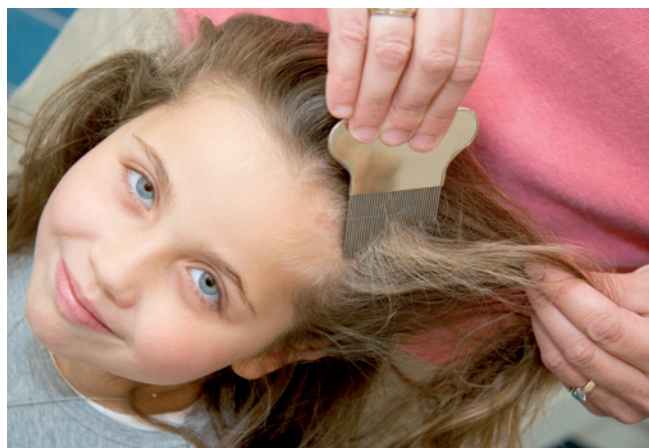
De uitkambehandeling is het meest natuurlijke middel tegen hooftluis

Als de uitkambehandeling niet heeft gewerkt dan kunt u dit herhalen in combinatie met een antihooftluismiddel.